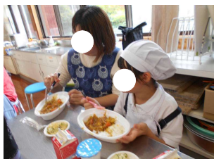
【2年 カレー&サラダづくり】