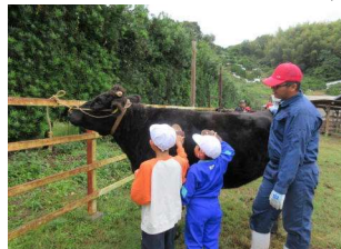
【1年 八女農北山牧場にて】

ようやく秋が深まってきて、運動場で思う存分遊ぶことができるようになりました。学校は、スポーツの日を含む三連休をはさんで、後期がスタートしました。始業式では、子どもたちと前期をふり返り、本年度の重点目標である「自分の考えを分かりやすく書き表す」ことについて、『書いている』という自己評価した子が93%なので、さらに『相手に伝わるように』考えの理由や根拠を書く力をつける等レベルアップをしていくことが大事だと話しました。