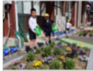
【きれいに咲いたね!】

先日、昨年度に続き今年度も、八女交通安全協会星野支部と星野校区青少年健全育成会から、とびだし注意の看板をいただきました。3月末までに、各地区に男の子と女の子が描かれた看板が設置されます。ありがとうございました。