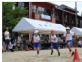
【「ゴールをめざして」】