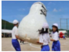
【「だるまさんの一日」】