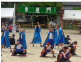
【高学年ダンス「新しい船出」】