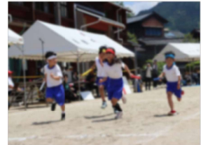
【小中合同「紅白リレー」】