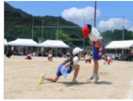
【タグ取り合戦「星野の陣」】