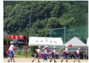
【低学年ダンス「ズートピア」】